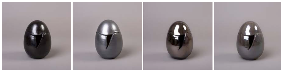
Esemplare Nero Opaco

Ne sono espressione la serie di inedite sculture in edizione limitata realizzate per volontà, disegno e secondo le istruzioni del Maestro Roberto Paolini, presentate il giorno dell'inaugurazione nella Galleria Bianconi e, in contemporanea, presso il bookshop di Palazzo Fortuny , in occasione dell'apertura della 56 Biennale di Venezia .